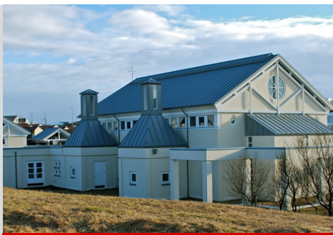
HL. JÓSEFSKIRKJA HAFNARFIRÐI

Messa í Þorlákskirkju, Þorlákshöfn, messa kl. 17:00 á pólsku.