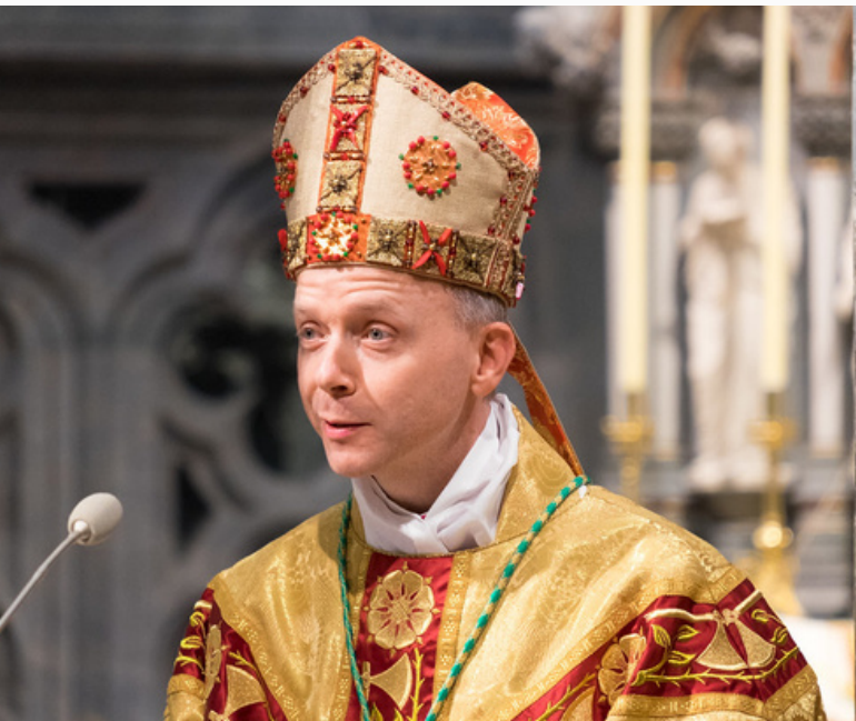
Eirík Varden, biskup í Þrándheimi

Minningarathöfn um Eirík Valkendorf (um 1465-1522), erkibiskup í Noregi