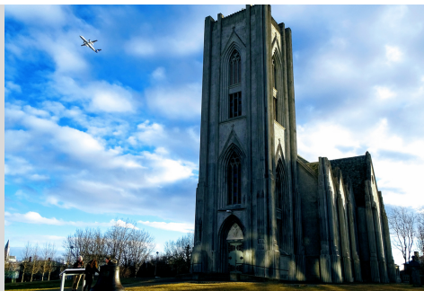
DÓMKIRKJA KRISTS KONUNGS

Dómkirkja Krists konungs í Landakoti Hávallagötu 16, 101 Reykjavík.