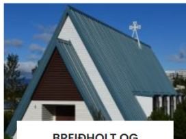
BREIÐHOLT OG SUÐURLAND